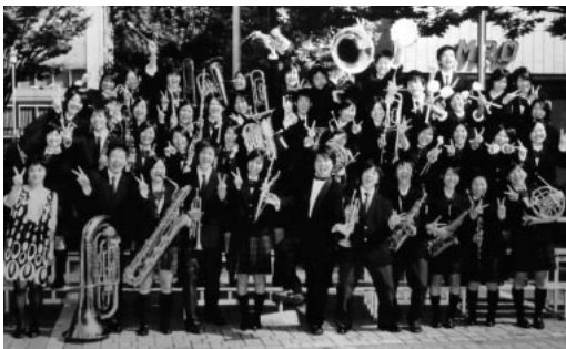
上・下 吹奏楽部東日本吹奏楽大会

校週5日制の影響で密度の濃い授業と両立させている現役生には頭が下がります。高い実績を挙げた部活動が功を奏し、20年度の新入生募集も好調、競争率も都内屈指の高倍率となりました。今年度からは部活動による推薦入学制度が導入され、豊島高校は文武両道・そして中学生に「選ばれる」学校になりつつあります。