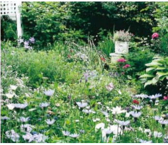
▲1階の庭は花咲く野原をイメージ

▼日の当たる庭園 園芸が趣味で、今から27年前に将来は周りに家が建て込んで庭に日が当たらなくなると思い、日の当たる2階でも庭いじりの出来る様にと今の家に建て替えました。夏は日射が強すぎますから寒冷紗を張りますと陽は大