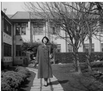
▲懐かしい校舎を背景に一コマ