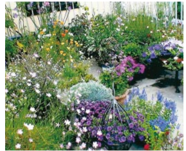
▲2階のベランダはまさに屋上庭園

▼屋上庭園の意外な苦労! 昨今は夏の都市の気温を下げるように屋上庭園が勧められていますが、やってみると水遣りも大変ですけれど、エレベーター無しでは重たい土や鉢植えを持ち上げたり下ろしたりがもつと大変です。その為、後々は小さなクレーンを取り付けられる様にしました。冬は軒下に鉢を集めて、軽くて光を通す保温シートで保護しますのでかなりの物は越冬できます。